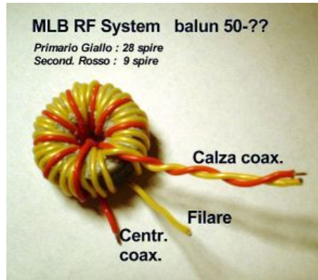
testo e foto di Aldo Moroni

Il trasformatore ha un rapporto 9:1 con avvolgimento OL (OverLap). Il primario (da 27 spire) è collegato da un lato al morsetto della longwire, dall'altro alla calza del coassiale. Il secondario (da 9 spire) è collegato da un lato alla calza e dall'altro al centrale del coassiale. Dalle prove fatte è risultato che separando elettricamente le masse si ha una maggiore riduzione dei disturbi generati all'interno dell'abitazione.