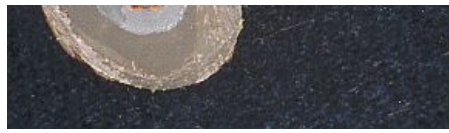
testo e foto di Aldo Moroni